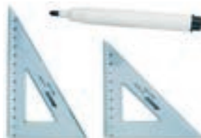
Pennarello Righello - Squadretta