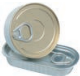
Scatoletta per pesce/carne