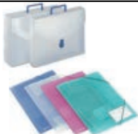
Cartelle-Cartelline in plastica