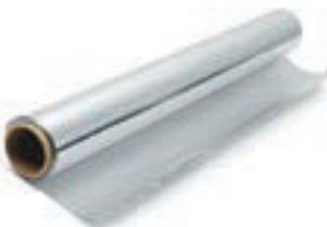
Fogli tipo domopack