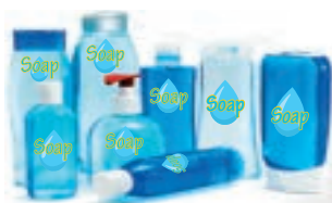
Flacone shampoo Dispenser