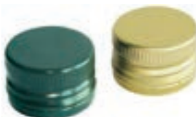
Tappi a vite per bottiglie