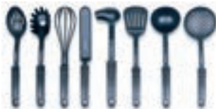
Utensili da cucina