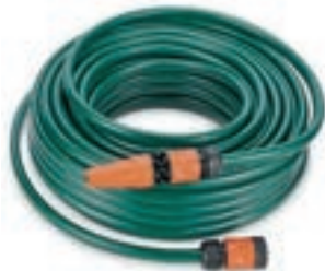
Tubo da irrigazione