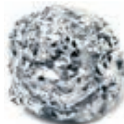
Involucro alluminio per dolci o cioccolata