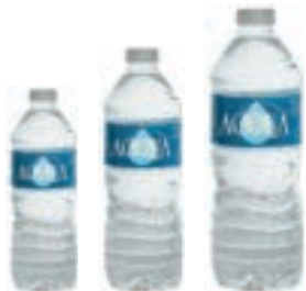
Bottiglie acqua minerale