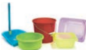
Bacinella - Catino Paletta