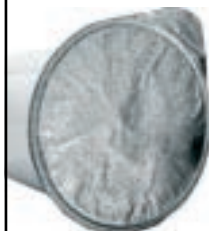
Coperchi in alluminio dello yogurt