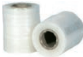
Film per imballaggi in plastica