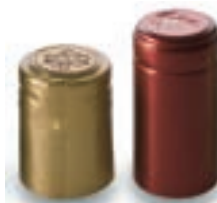
Capsule bottiglie di vino