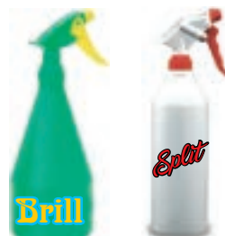
Spruzzini (tipo sgrassatore)