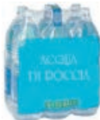
Film per cluster 6 bottiglie