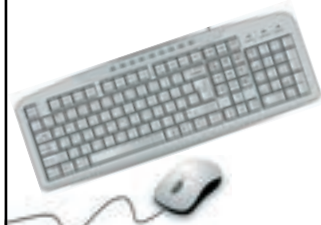
Tastiera e Mouse