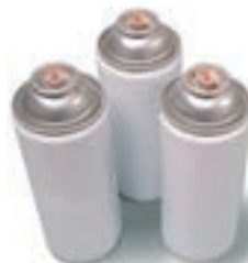
Bombolette aerosol/spray senza simboli di pericolo