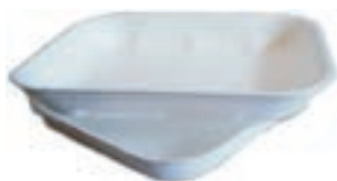
Vaschetta per alimenti