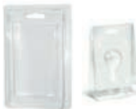
Bliester trasparenti preformati