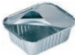
Vaschetta alimenti e per cibo di animali