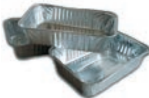
Vassoi per cottura cibi