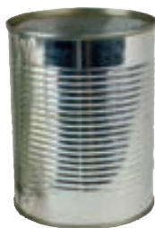
Barattolo in alluminio