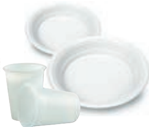
Piatti e bicchieri in plastica