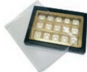
Vassoio scatola di cioccolatini