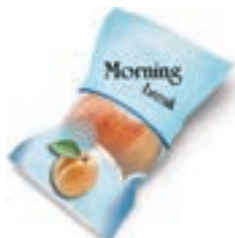
Sacchetto merendina o snack