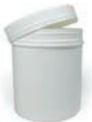
Barattolo di plastica