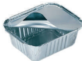
Vaschetta alimenti e per cibo di animali