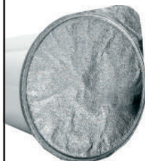
Coperchi in alluminio dello yogurt