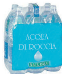
Film per cluster 6 bottiglie