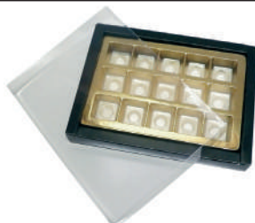
Vassoio scatola di cioccolatini