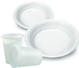
Piatti e bicchieri in plastica