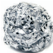
Involucro alluminio per dolci o cioccolata