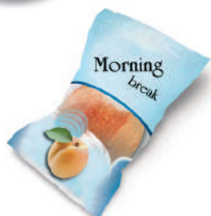
Sacchetto merendina o snack