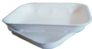
Vaschetta per alimenti