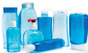
Flacone shampoo Dispenser