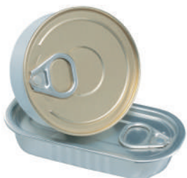
Scatoletta per pesce/carne