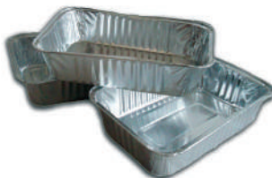
Vassoi per cottura cibi