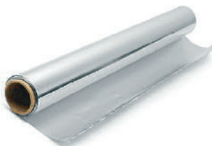
Fogli tipo domopack