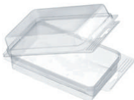
Blister trasparenti preformati