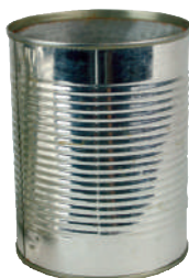
Barattolo in alluminio