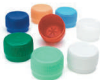
Tappi in plastica