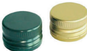
Tappi a vite per bottiglie