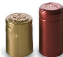
Capsule bottiglie di vino